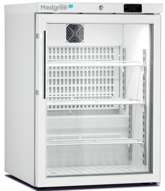
MLRE 150 G