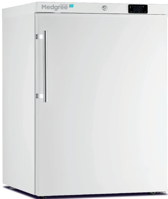
MLRE 150 S